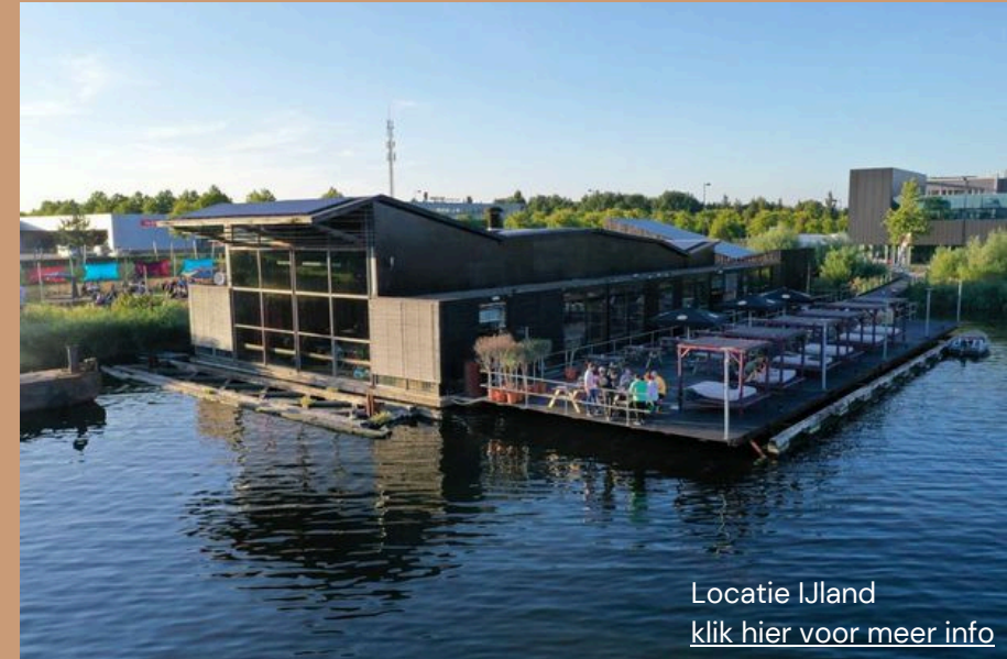
Locatie IJland klik hier voor meer info